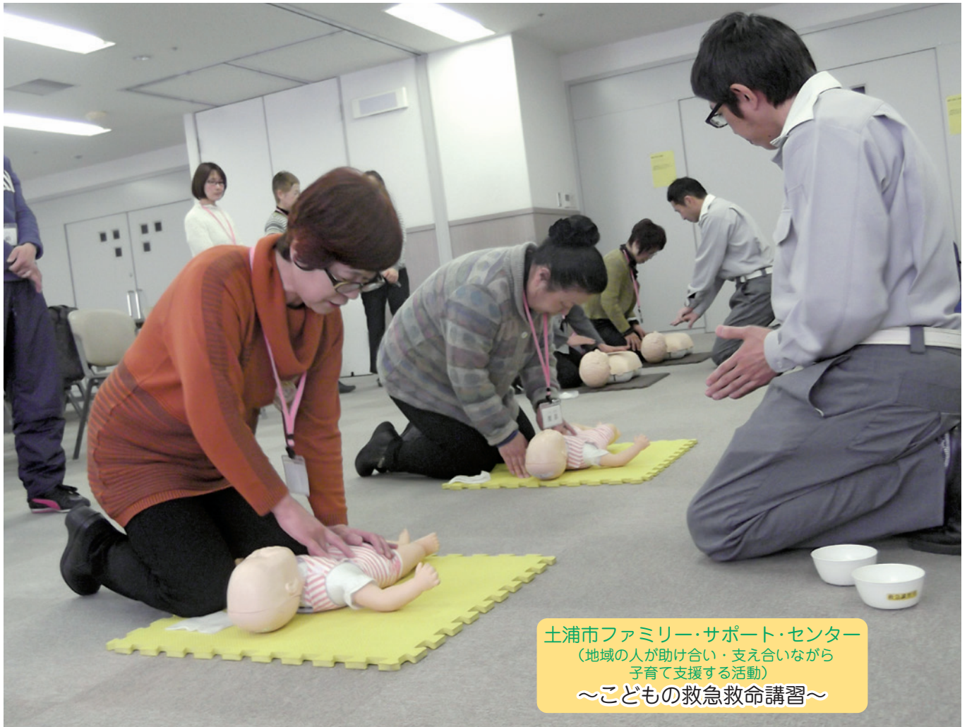
土浦市ファミリー・サポート・センター (地域の人が助け合い・支え合いながら 子育て支援する活動) ～こどもの救急救命講習～